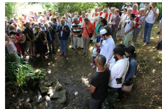
Lecture de la sourate des Gens de la Caverne (pardon 2019).